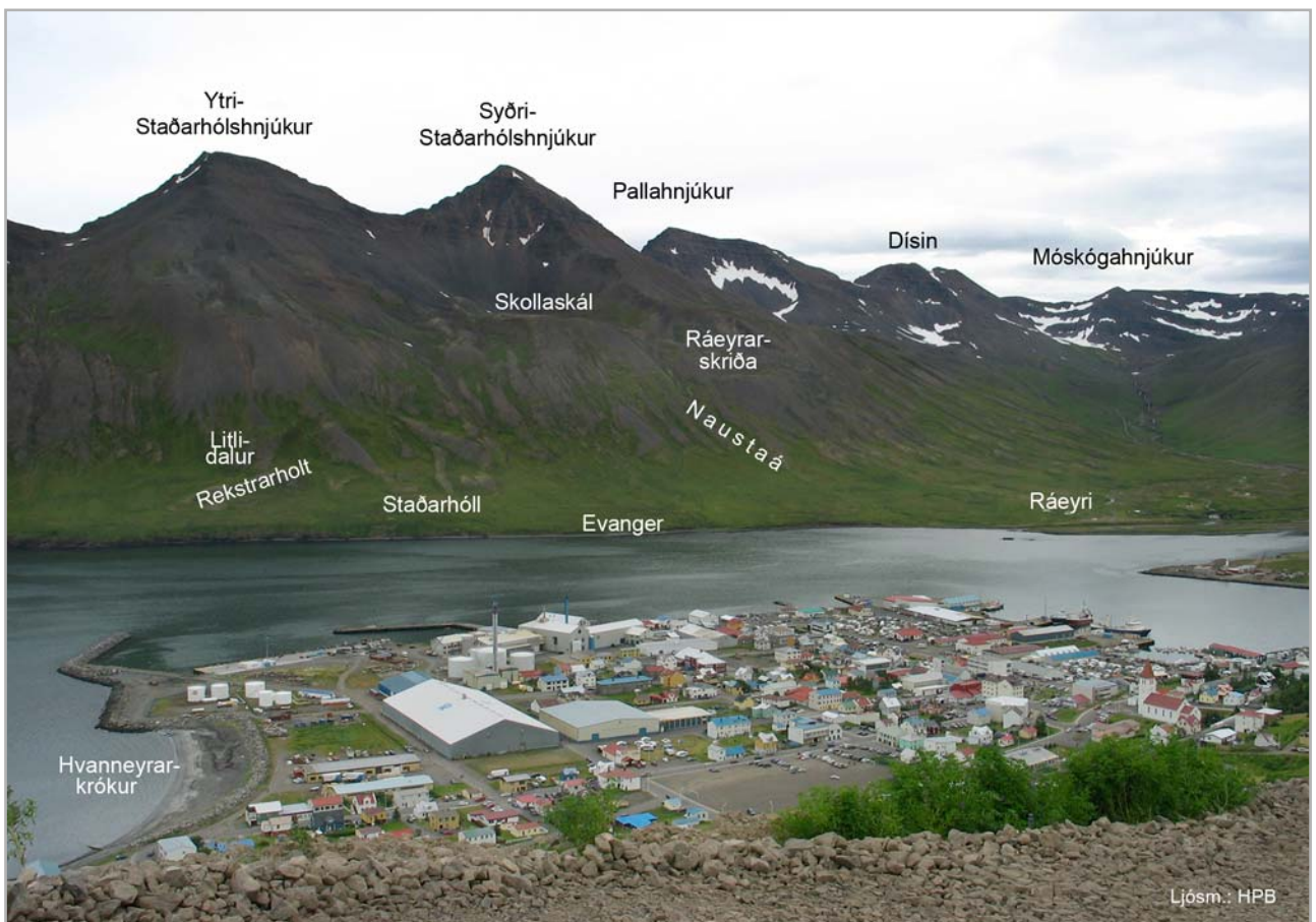
Horft til austurs frá Hvanneyrarskál

eyrina, svo aðeins sést fremsta horn hennar og Ráeyrarhólmi (7) sem framan við hana er. Eyddi hún að fullu helstu verstöð fjarðarbúa og uppsátur, sem norðan var á eyrinni, en áin gróf nýjan farveg þvert vestur sunnan skriðu og eyrar. Er skriða þessi all úfin, en nokkuð gróin og nefnd Ráeyrarskriða (8). Býli var svo reist 183.. skammt út frá skriðunni og nefnt Ráeyrarkot (9) var þar búið til 12. apríl 1919 en til þess náði suðurjaðar hins mikla snjóflóðs sem getið hefur verið. Fórst bærinn en menn náðust með lífi, hefir byggð ekki verið þar síðan. Þar hafði og litlu neðar verið húsmannsbýli um stund, en áður komið í eyði nefndist það Smíðjugerði (10). Tómthúsbyli hafði og reist verið út og niður við víkina norðan eyrar, stóð það fast við fjöru og nefndist Bakki (11) fórst það að fullu ásamt 4 mönnum í flóðinu 1919.