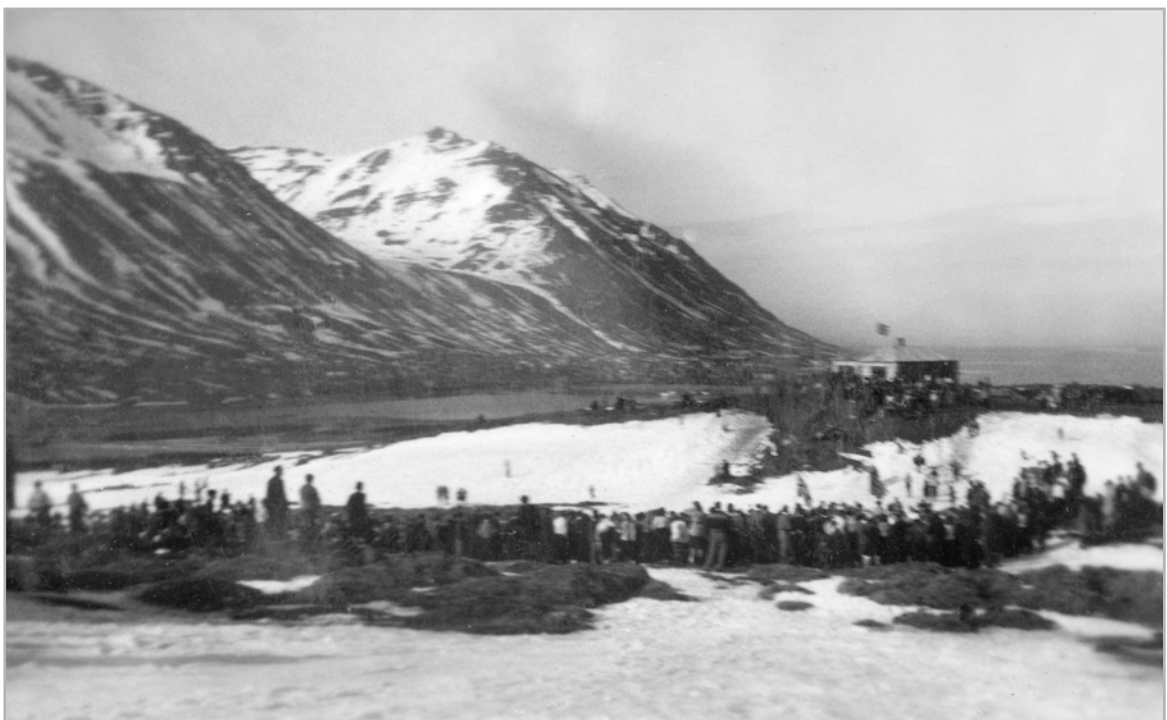
Skiðafell á Saurbæjarási